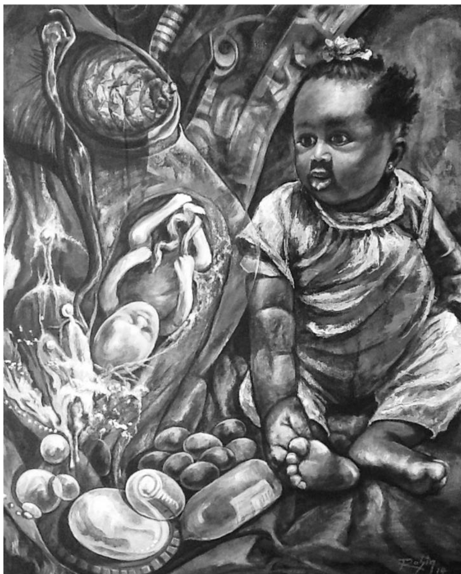
Rasin, La renaissance , 2014

Les défaillances du système de l'état civil haïtien l'empêchent de remplir sa mission d'enregistrer tous les faits relatifs à l'état des personnes de la naissance à la mort comme cela devrait se faire. Ce dysfonctionnement est très préjudiciable à l'individu comme à l'État lui-même. La modernisation du système d'enregistrement des ressortissants haïtiens aussi bien à l'intérieur qu'à l'extérieur du pays, est une urgence