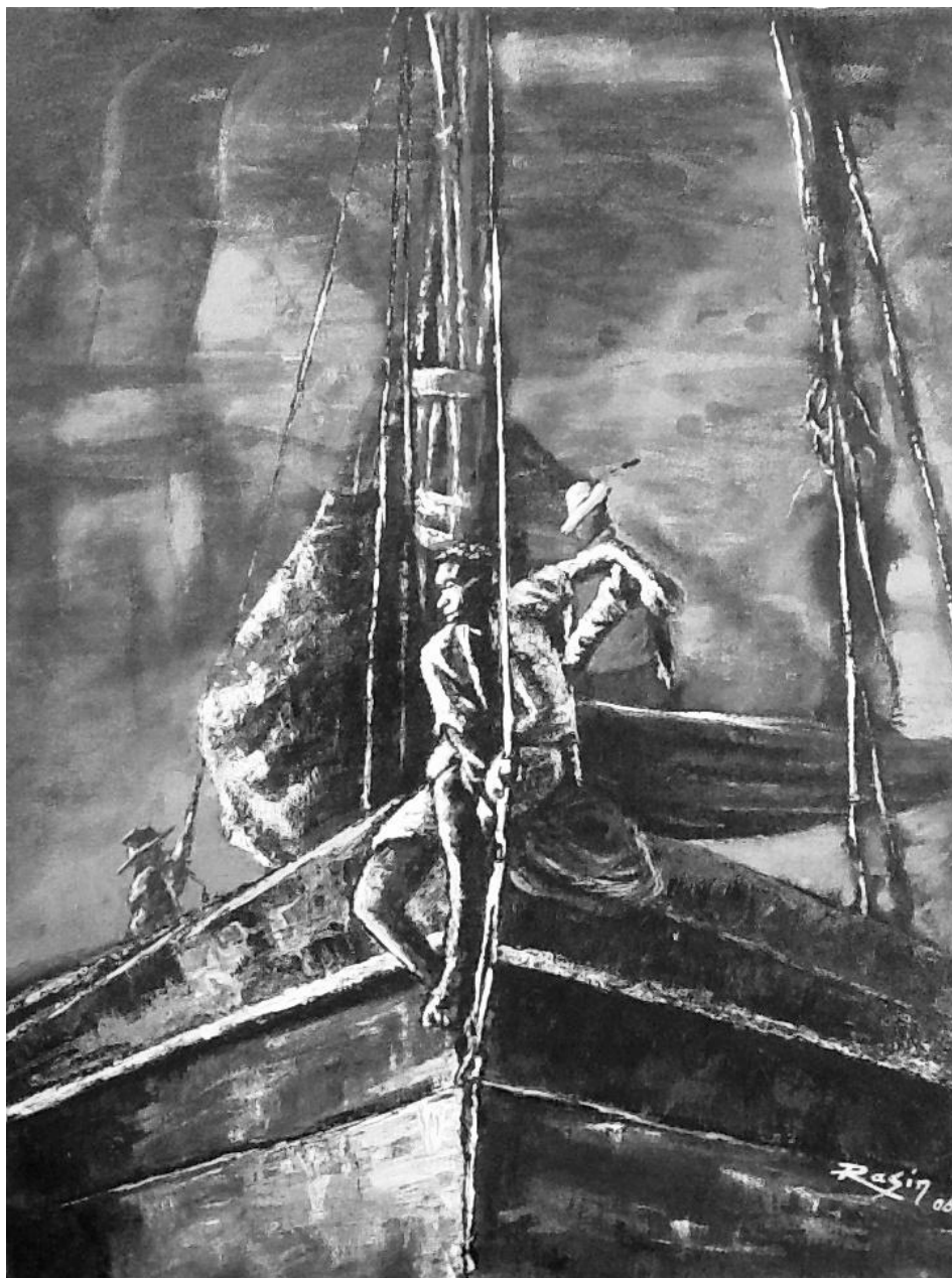
Rasin, Flamme d'espoir , 2016

L'insuffisance de bureaux de l'état civil sur le territoire national pose problème. Il existe en tout 186 bureaux de l'état civil dans tout le pays dont au moins un bureau dans chaque commu-