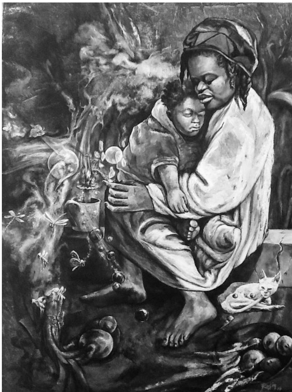
Rasin, Flamme d'espoir , 2014

Dans les sections communales reculées où il n'y a pas d'OEC, les déclarations provisoires peuvent être faites auprès des ASEC et CASEC qui doivent en assurer le suivi pour l'enregistrement correct et régulier par devant les OEC compétents, suivant les articles 11 et 19 de la Loi portant organisation de la collectivité territoriale de la section communale. Pour les Haïtiens vivants à l'étranger, les déclarations se font auprès des agents consulaires dans les ambassades ou consulats haïtiens, selon les termes de l'article 10 de la législation sur les attributions du consul. Pour les naissances en mer, la déclaration doit être faite et l'acte dressé par le chef du navire dans les 24 heures ou à défaut, dès